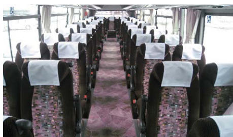
以茶色為主調色彩，溫和的氣氛