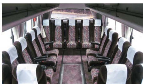
車廂後部可變沙龍