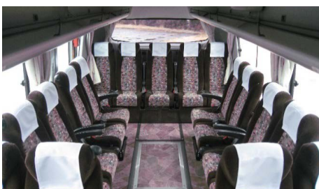
후방 살롱 세트 가능