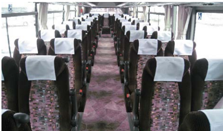
갈색 바탕의 차분한 분위기