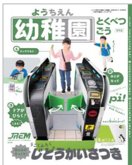
▼ 参加記念品の一例

参加記念品：先着 400 名さまには JR 東日本メカトロニクス(株)提供、小学館「幼稚園」特別号 (改札機工作キット付録付き)、それ以降は交通系 IC カードのキャラクターグッズや鉄道グッズなどから、お一人さまおひとつプレゼントします。