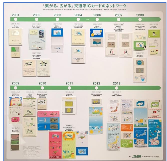
▲ 展示参考イメージ