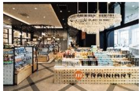
▲ TRAINIART (トレニアート) 店内